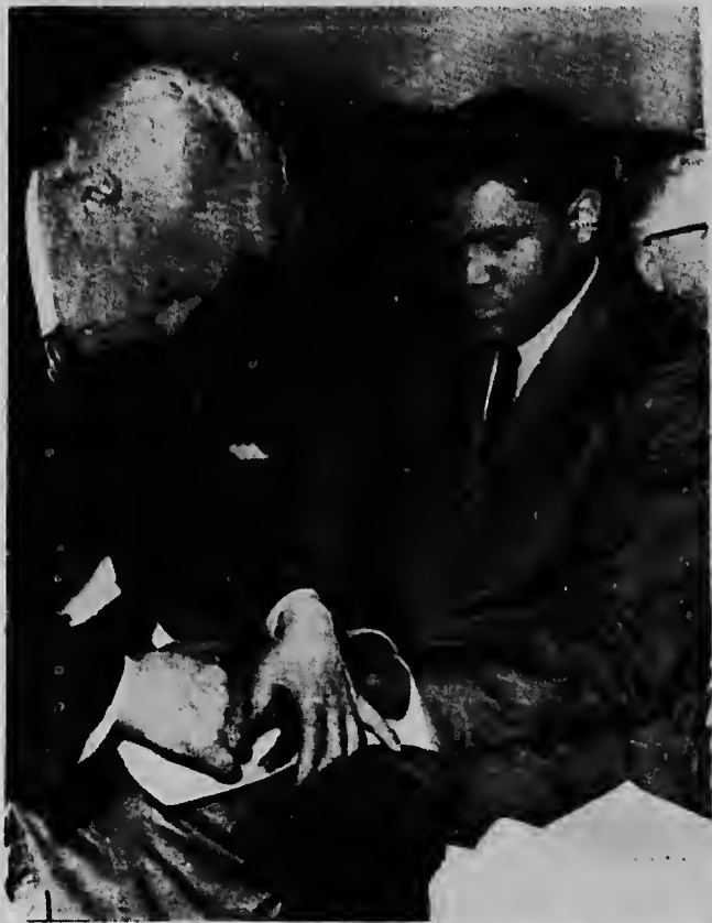
CHICAGO -- Radiophoto UPI -- Campeon mundial Ernie Terrell (WBA) na man robey y Cassius Clay (Campeon mundial di The Ring) ta tuma midi di nan man pa Sam Frager trahador di Glubs den Illinois Athletic Comision, A ser anuncia cu e pelea lo tuma lugar dia 29 di maart.

ademá tin cu pone su mes bau di control di reclassering y tene su mes na e indicacionnan di e stichting aki.